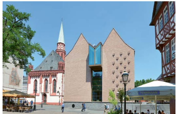
Alte Nikolaikirche und Historisches Museum